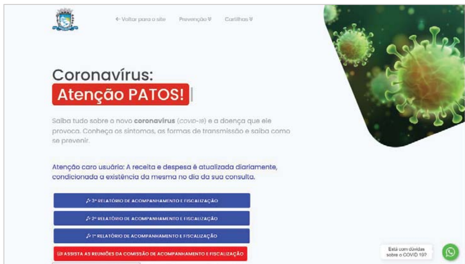
Imagem 1. Consulta ao link https://patos.pb.gov.br/servicos/coronavirus , em 1º de setembro de 2020, às 16h47min.

https://patos.pb.gov.br/servicos/coronavirus